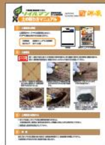
採取マニュアル(本資料)