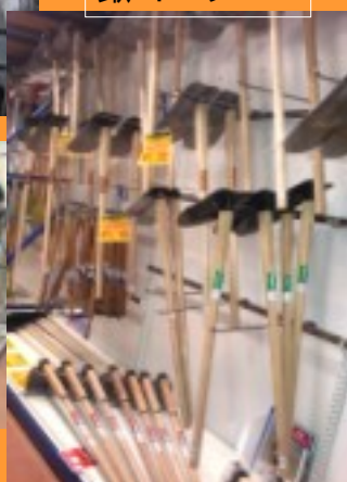
鋤・土嚢工具コーナー

店内、入って左側奥に鎌・鋤・土嚢工具コーナーがあります。鎌は長くご愛用できる青鋼スパーから、園芸用まで豊富な品揃えが自慢です。又、刈り込み鋤、剪定鋤、芽切鋤等も専門のお客様にもご愛用いただいております。 鋤・ガンマクなどの土嚢工具に、つぎましては、加治屋さん、ついでに、夢アグリの上の「夢」の刻印も入つてます。是非、ご覧になつてください。